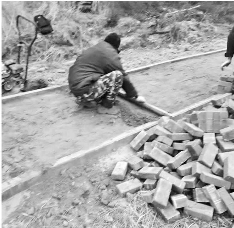
Пешеходная дорожка на ст.Палики.

Пешеходная дорожка на ст.Палики – работают около 10 человек.